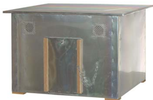
CAJÓN PALOMOS FORRADO CHAPA

Ref. 30002024 Medidas: frente 55 cm; fondo 50 cm; alto 40 cm