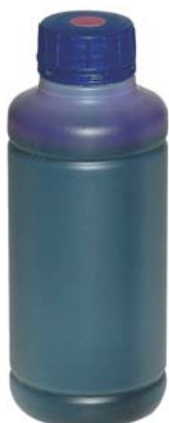
PINTURA ESPECIAL PALOMOS DEPORTIVOS Ref. 30010022. Violeta Capacidad: 500 ml