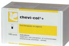
CHEVI-COL+ Ref. 30008046 Anti-tricomaniasis Estuche con 100 cápsulas