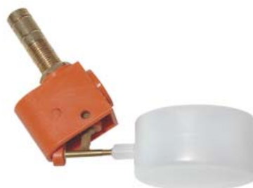
FLOTADOR PLANO SEMI-AUTOMÁTICO