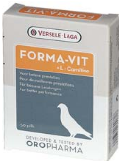
FORMA-VIT (+L - Carnitine)

Ref. 30008054 Para un mejor rendimiento 50 cápsulas