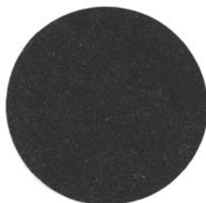
FONDO NIDO PALOMOS CON VELCRO