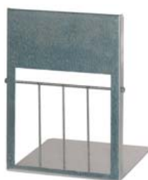
TRAMPILLA CAJÓN PALOMOS G.