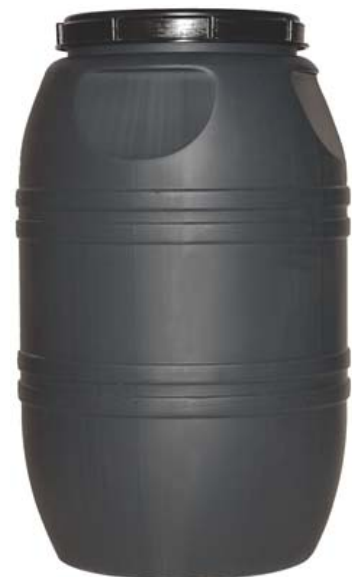
DEPÓSITO AGUA 220 LITROS