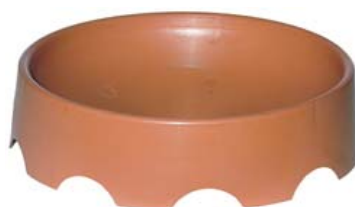
NIDO PALOMOS PLÁSTICO