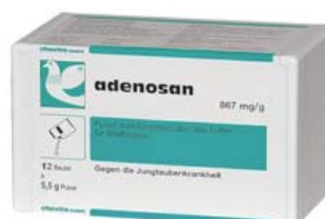
ADENOSAN Ref. 30008058 Polvo Estuche con 12 sobres de 5,5 gr