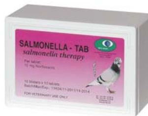
SALMONELLA - TAB

Ref. 30008070 Tratamiento para la coccidiosis y tricomoniasis 10 blisters x 10 tablets