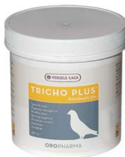
TRICHO PLUS (Ronidazole 5%)

Ref. 30008054 Para un mejor rendimiento 50 cápsulas