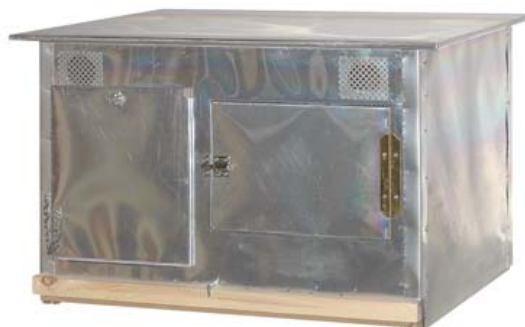
CAJÓN PALOMOS SOLEDADO CON BANDEJA

Ref. 30002024 Medidas: frente 55 cm; fondo 50 cm; alto 40 cm