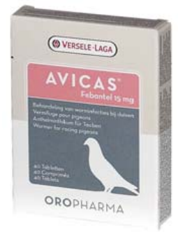
AVICAS (Febantel 15 mg)

Ref. 30008014 Para la tricomoniasis 40 comprimidos