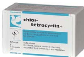
CHLOR-TETRACYLIN+ Ref. 30008056 Polvo Estuche con 12 sobres de 7,5 gr