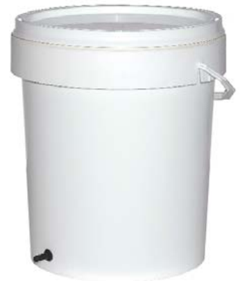
DEPÓSITO AGUA 25 LITROS