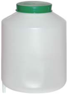
DEPÓSITO AGUA 8 LITROS