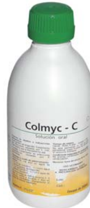
COLMYC - C