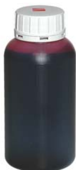
PINTURA ESPECIAL PALOMOS DEPORTIVOS Ref. 30010037. Rojo Capacidad: 250 ml