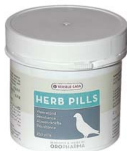
HERB PILLS Ref. 30008069 250 cápsulas