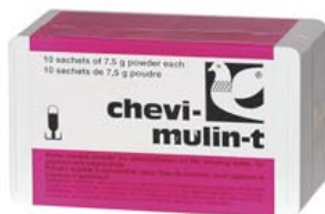
CHEVI-MULIN-T Ref. 30008048 Contra infecciones respiratorias Estuche con 100 cápsulas