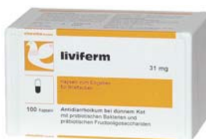
LIVIFERM Ref. 30008033 Estuche con 100 cápsulas