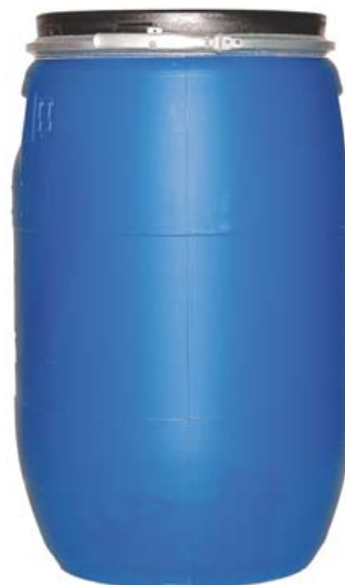
DEPÓSITO AGUA 100 LITROS