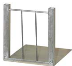
TRAMPILLA CAJÓN PALOMOS P.

Ref. 30002035 Medidas: frente 60 cm; fondo 50 cm; alto 40 cm