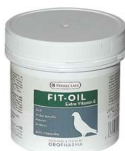
ACEITE HÍGADO BACALAO Ref. 30008023 300 cápsulas