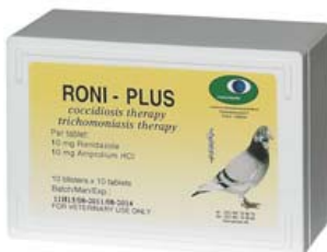
RONI - PLUX

Ref. 30008070 Tratamiento para la coccidiosis y tricomoniasis 10 blisters x 10 tablets