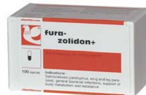
FURA-ZOLIDON+ Ref. 30008045 Anti-salmonelosis Estuche con 100 cápsulas