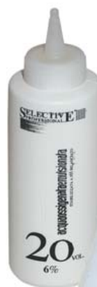
DECOLORANTE PALOMOS Ref. 30010002 Capacidad: 20 Vol