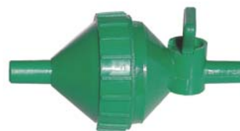
FILTRO CON LLAVE Ref. 30005025 Desmontable