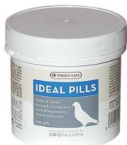
IDEAL PILLS Ref. 30008018. 100 cápsulas Ref. 30008019. 500 cápsulas