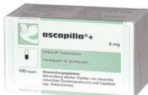
ASCAPILLA+ Ref. 30008062 Estuche con 100 cápsulas