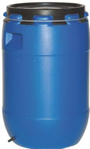
DEPÓSITO AGUA 70 LITROS