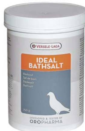
GEL BAÑO IDEAL

Ref. 30008017 Control y tratamiento tricomoniasis 30 comprimidos