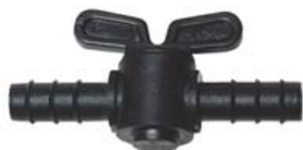
LLAVE DE PASO Ref. 30005021