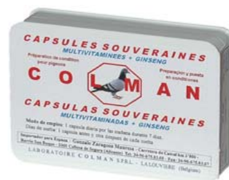
COLMAN Ref. 30008032 Multivitaminadas + Ginseng