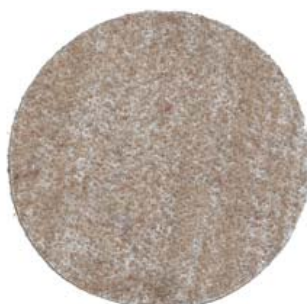
FONDO NIDO PALOMOS