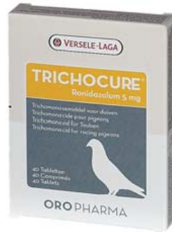
TRICHOCURE (Ronidazolium 5 mg)

Ref. 30008047 Para palomas mensajeras 250 gr