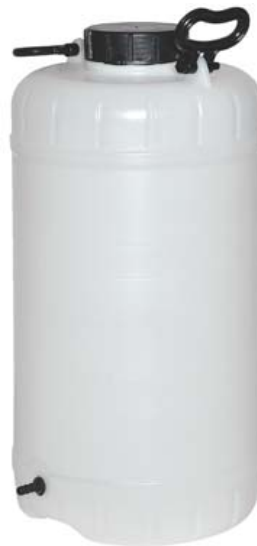
DEPÓSITO AGUA 30 LITROS