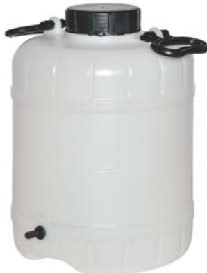
DEPÓSITO AGUA 15 LITROS