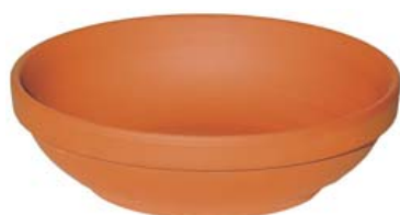
NIDO PALOMOS BARRO