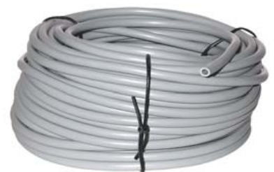
MANGUERA CONDUCTORA AGUA